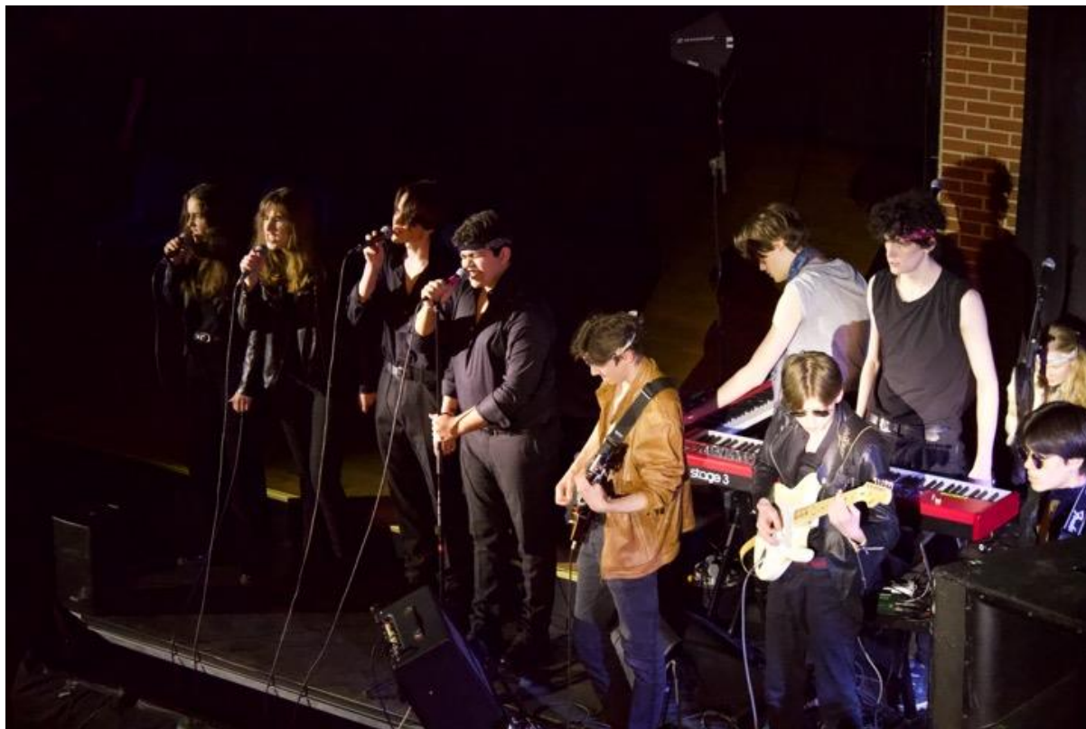
«DØNN» fremført på Langhugen VGS. Slik blir et ikke i år