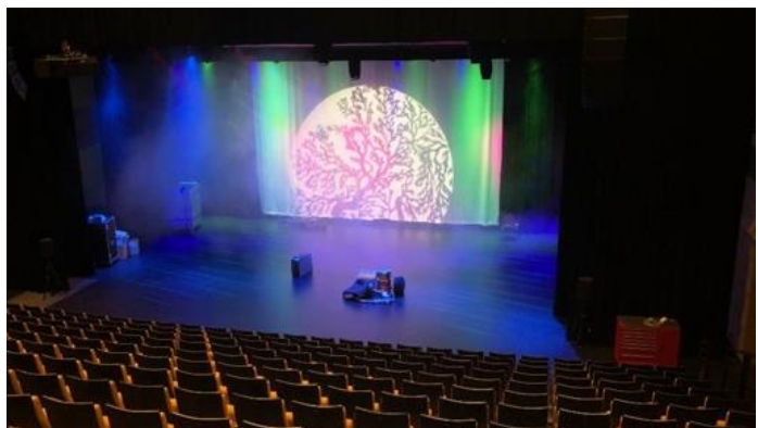
Bilde fra innsiden av kultuset

Likevel er skuespillerne motiverte. Med færre sketsjer får man bare se det beste, og de har øvd intensivt i