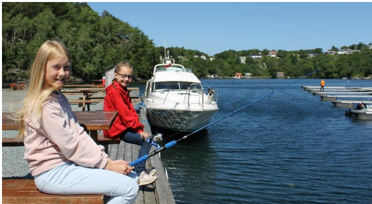
Kystkultur og bruk av kystens kvalitetar går igjen som ein viktig verdi i alle generasjonar på Bømlo.

Desse momenta går igjen i alle generasjonar, over heile Bømlo.