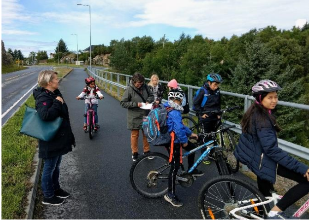
«Ruslemaking» med elevar frå Meling skule, august 2018.

Dette kan me forhindre i Bømlo med berekraftig, langsiktig, politisk planlegging. Denne utfordringa er og eit døme på noko som krev tverrsektorielle tiltak, men kor små kommunar kan ha eit fortrinn, om ein utnyttar faktorar som korte kommunikasjonslinjer og god sosial oversikt.