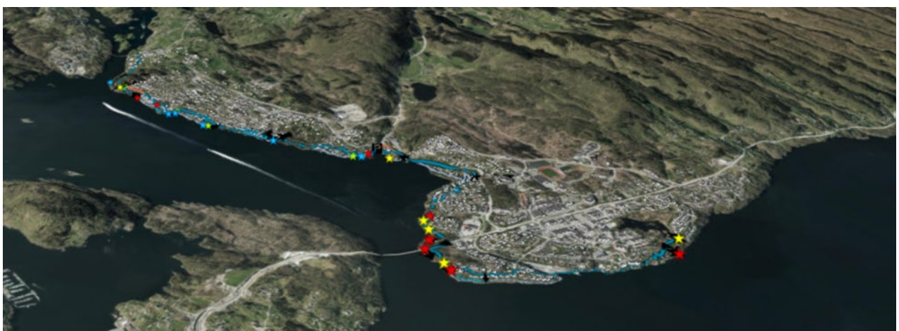
III: utsnitt frå 3d modell som er brukt i planlegginga