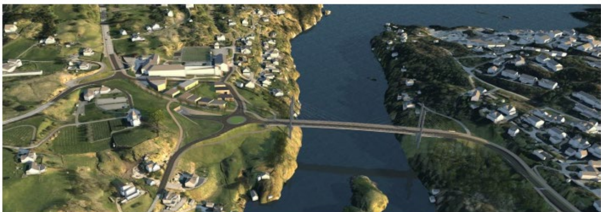
Figur 45: Illustrasjon av Alversund med framtidig tunnel og arealutvikling.

Av omsyn til landskapstilpassing og lågare vegfyllingar, samt moglegheit for framtidig tunnel for fv565, bør brua leggest lågt. Seglingslei på eine sida av sundet, aust for Kongsøyna, tilseier at brua bør vera nokså flat, for ikkje å markera ei lei midt i sundet. Brua må ha minst same seglingshøgde som i dag.