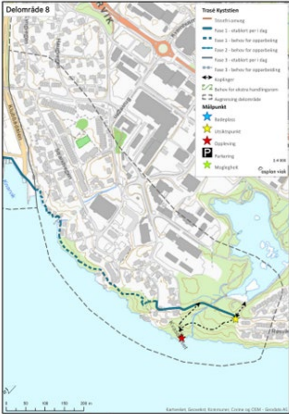
Figur 34: Delstrekning 8 – forslag til trasé