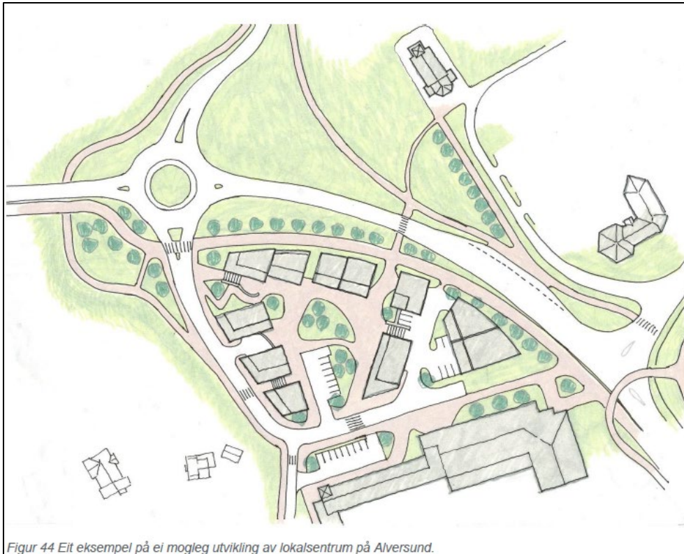
Figur 44 Eit eksempel på ei mogleg utvikling av lokalsentrum på Alversund.