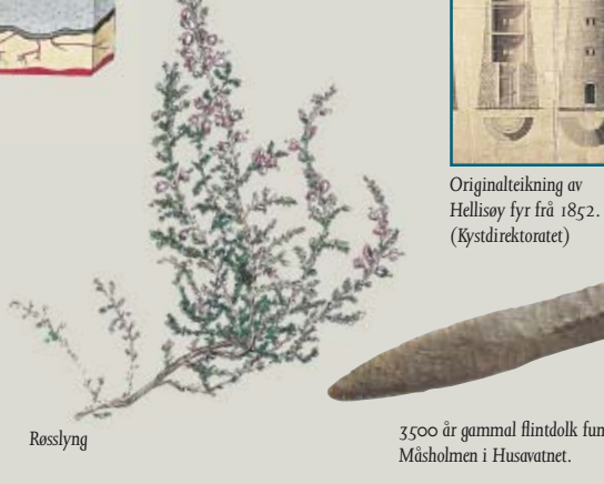
Røsslyng 3500 år gammel flintdolok funne på Måsholmen i Husavatnet.

Krigen hadde gjort at tilførselen av kol var usikker. Sleppebåtar kom frå Bergen med lastepannar. I mellomkrigstida vart det stilt spørsmål ved denne enorme rovdrifta på ressursane, m.a. ville brukarane på øya sjå seg at dei hadde nok brensel. Rundt 1920 vart det slutt på kommersiell torvdrift, men øybuane tok framleis torv til eige bruk.