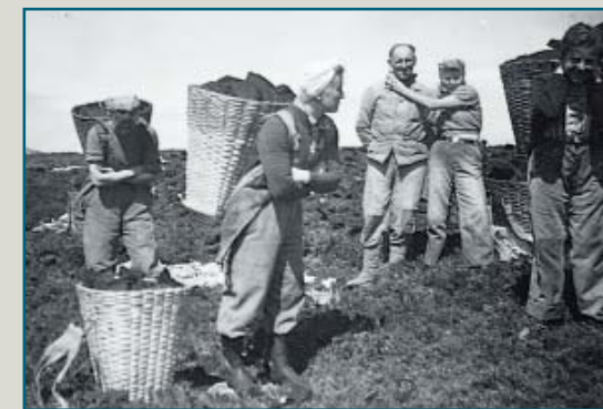
I torvonna tok heile familien del. Torva vart teken ut i april eller mai; spadd opp frå lange snitt som kunne vera fleire meter djupe. Oftast vart ho teken opp i flate skiver og tørka på myrflaten. På seinsommaren var torva oflutt tørr nok til å frakstast til torvhuset i båt. Den tørre torva vart sidan bore til bustaden i kiper og nytta som brensel. Foto: Ved Lønnveggen kring 1944.