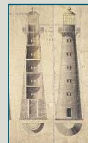
Originalteikning av Helligsøy fyr frå 1852. (Kystdirektoratet)

Hellisøy fyr er eit ruvande og velkjend landemerke mot horisonten, der det ligg på ei lita øy i sør mot Fyrsundet. Fyret vart tent i oktober 1855, og har sidan vore ein viktig vegvisar for dei sjøfarande. Det runde støypejernstårnet har ei høg på 33 m og ei lyshøg på 46 m over hogvatn. Teknikken med å bygga fyr i støypejern vart henta frå Storbritannia i byrjinga av 1850-åra. På Helligsøy vart det òg bygd bustadhus for fyrvaktaren og familien hans, og til «fyrkarlen», men denne bygningen brann ned i 1902. Året etter vart det oppført to nye hus, eit til fyrvaktaren og eit til fyrvaktarasistenten. I 1954 vart fyret elektrifisert, og fullstendig automatisert i 1989. Helligsøy fyr er freda som ein del av Riksantikvarens sin verneplan for norske fyr. Fyret er ope for turistar som sommaren, og panoramasynet frå tårnet er einestående.