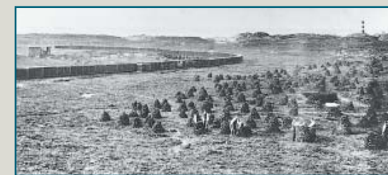
I 1875 vart Fedje selt til Fedje torvkompani for 14.000 Spd. Ved Stormark på sorsida av øya, på dei store torvmyrane, byrja så kompaniet å ta torv. Ved den vesle havna vart det bygd eit stort lagerhus for torv, og det gjekk skinnegang frå dette og oppover til torvmyrane. Under første verdskrigen var her stordrift.

Krigen hadde gjort at tilførselen av kol var usikker. Sleppebåtar kom frå Bergen med lastepannar. I mellomkrigstida vart det stilt spørsmål ved denne enorme rovdrifta på ressursane, m.a. ville brukarane på øya sjå seg at dei hadde nok brensel. Rundt 1920 vart det slutt på kommersiell torvdrift, men øybuane tok framleis torv til eige bruk.