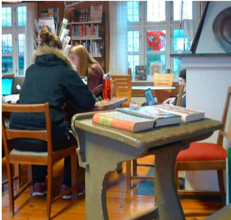
Skulebiblioteket i peisestova på Fitjar vgs

Det er store variasjonar på biblioteklokala i skulane. Planlegging av skulebibliotek skal vere inne i byggeprosjekt frå starten, både i nye skulebygg og ved tilbygg og ombygging av eldre skular. Skulebiblioteket skal ha sentral plassering i skulen og ha plass til både læringsaktivitetar, sosiale og kulturelle aktivitetar.