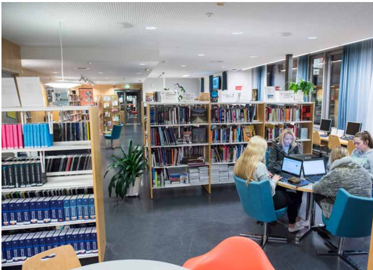
Frå skulebiblioteket på Askøy vgs.