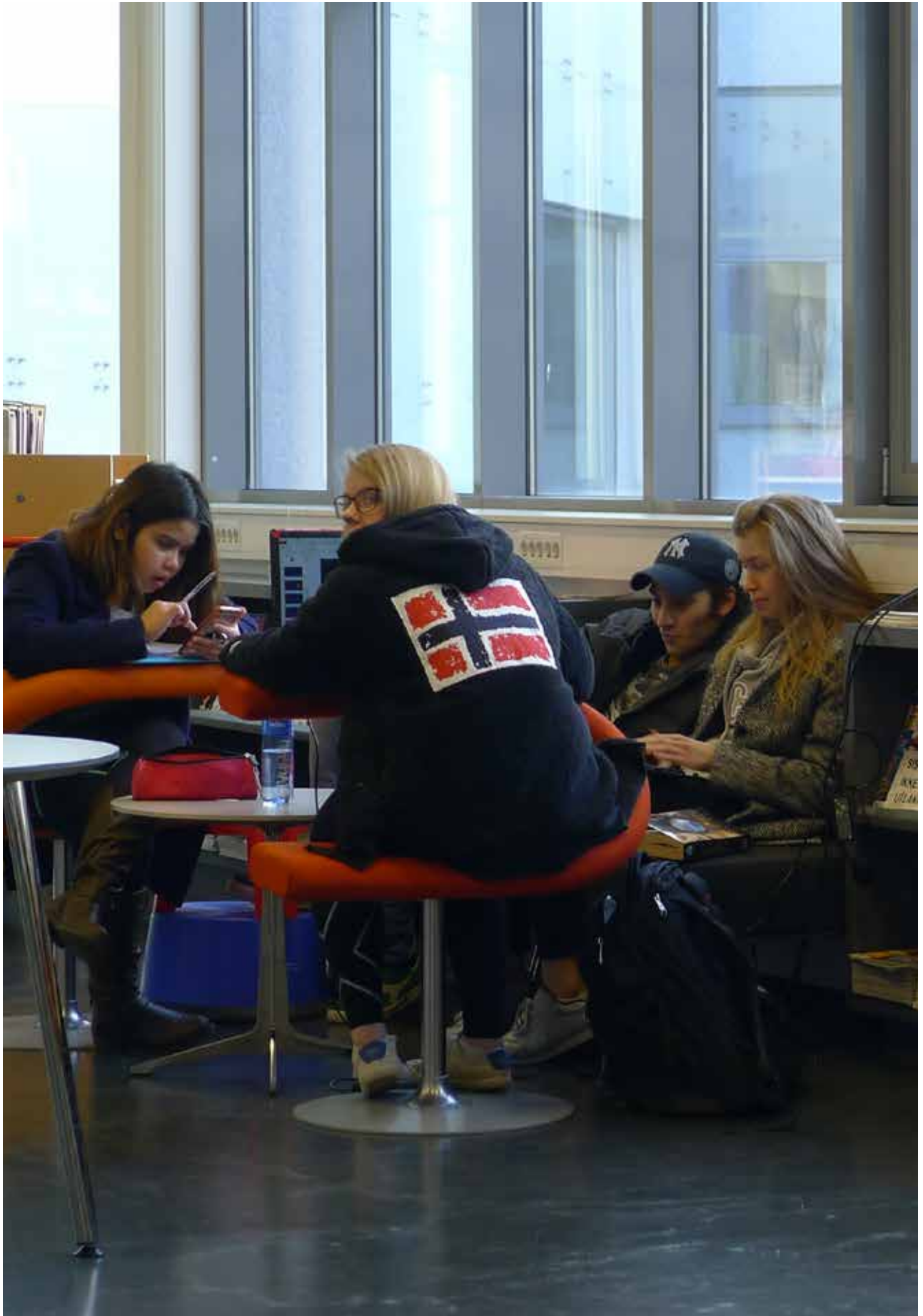
Frå skulebiblioteket på Årstad vgs.