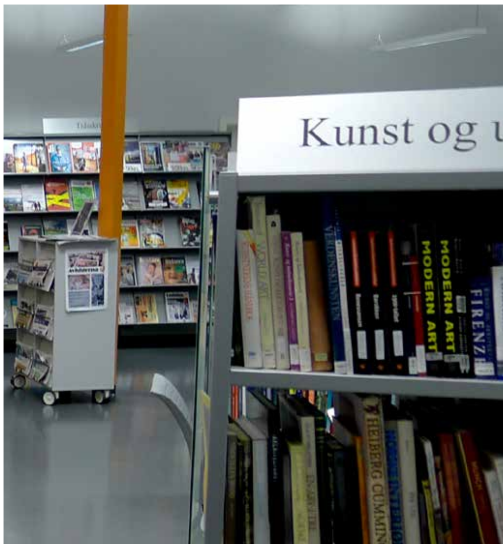
Frå skulebiblioteket på Kvinnherad vgs.

Opplæringsavdelinga finansierer stilling som skulebibliotekkoordinator i 100% stilling med arbeids-plass på fylkesbiblioteket. Koordinatoren gir individuell oppfølging av dei bibliotektilsette, sikrar tilgang og kvalitet i felles biblioteksystem, felles tenester, organiserer kurs, konferansar og fagsamlingar. Rettleiing ved tilsetjing av bibliotekarar ved skulane og oppfølging av felles planar og tiltak er del av stillinga.