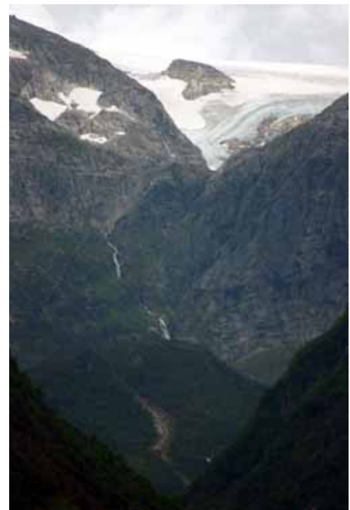
Frå Gjetingsdalen mot Folgefonna