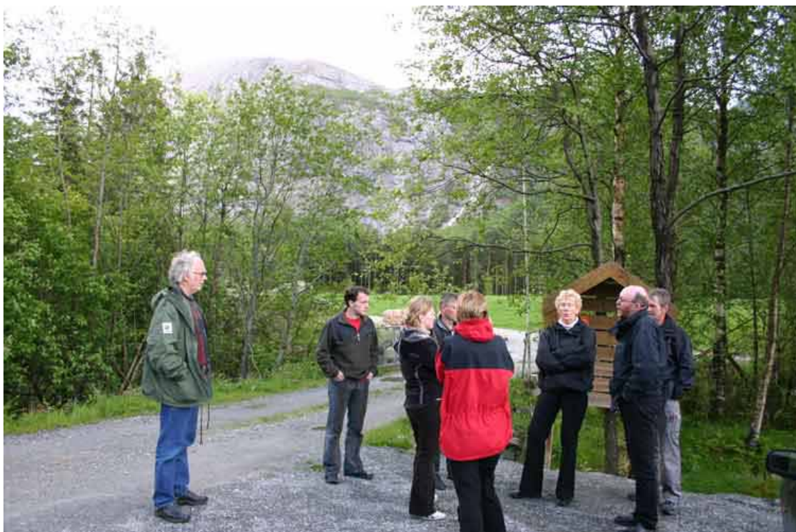
Uskedøler på synfaring oppover den flotte dalen sin i fasen med kartlegging og planlegging

http://www.rosendalstiftinga.no/index.html