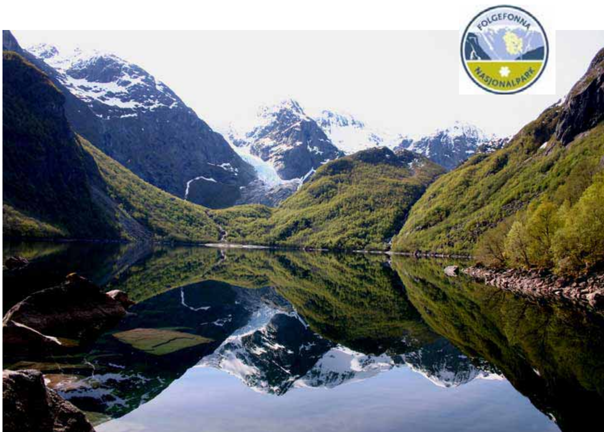
Folgefonna nasjonalpark Bondhusvatnet med breen i bakgrunnen

http://www.miljostatus.no/hordaland/tema/naturomrade/Verneplan_Folgefonna/index.htm