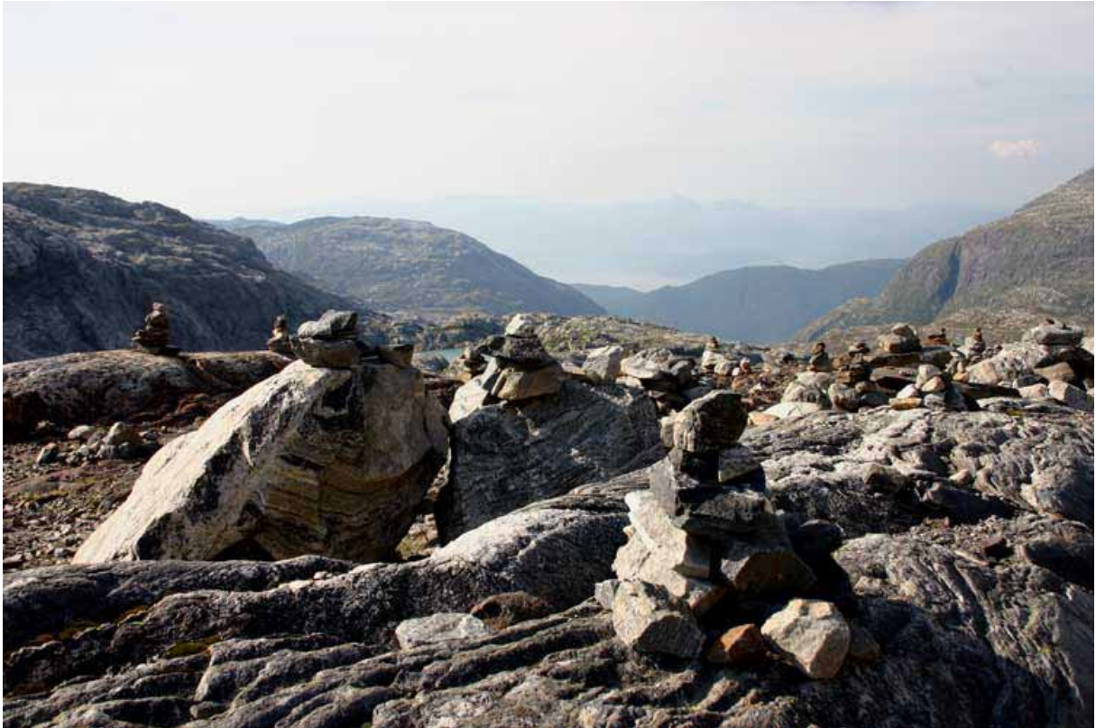
Impulsiv 'vardekunst' ved Sommarskisenteret