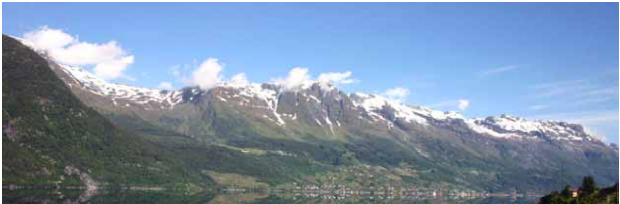
Mot midtre og nordlege del av Vikebygdkrinsen