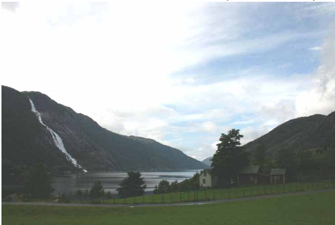
Åkrafjorden sørover mot Langfoss

Dei same tre områda som hadde dei opphavlege Streifa er i gang med å vidareutvikle dette til enda meir forpliktande samarbeid med fokus på næringsutvikling gjennom det som vert kalla "Landskapsparkar". Desse skal utvikle seg både innan sine avgrensa område, samarbeide seg i mellom, og dei kan heilt sikkert vera med å stimulere nye område til å kome i gang. Geoturisme er eit av grunnprinsippa. Det betyr at utvikling av opplevinger og reiseliv skal ivareta, forsterka og framheva staden sin eigenart innan natur, miljø, kultur, estetikk, kulturarv, og kome lokalsamfunnet til gode slik at ein held fram med å vera levande bygder med eit velstelt kulturlandskap. Les meir på www.landskapspark.no