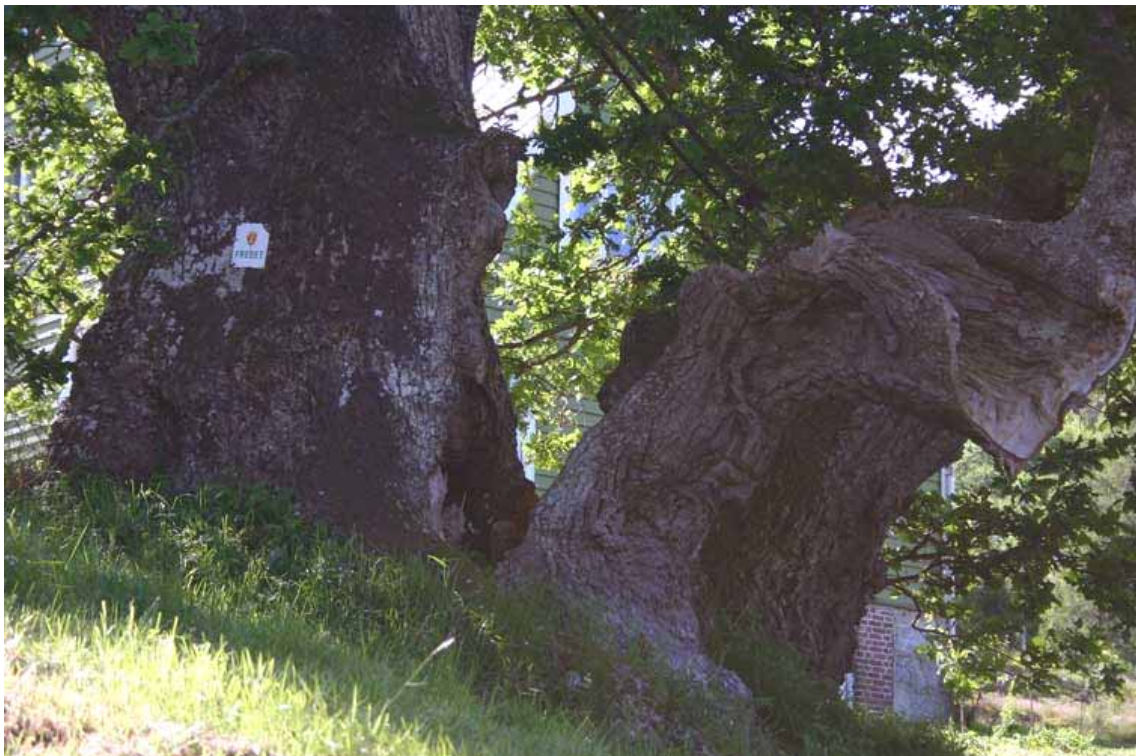
'Brureika' på Lothe - Noregs tjukkaste tre over 14 m i omkrins. Den er delt i to som halvøya, men har felles røter og er eit majestetisk tre