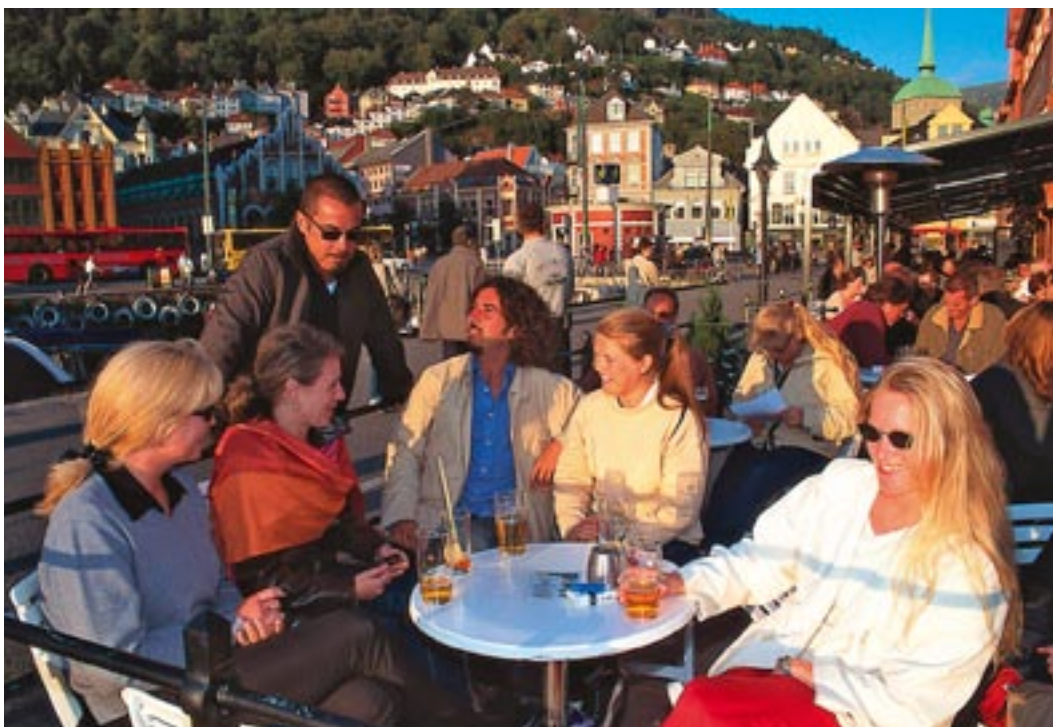
Hordaland har meir enn 30.000 studentar, dei fleste i Bergen. Studentane medverkar til eit mangfaldig uteliv og gjer byen til en livleg møteplass.

Målet er å utvikla Vestlandet sine ressursar og hevda regionen sine interesser og behov. Vestlandet er ein berebjelke i den økonomiske utviklinga i Noreg. God tilrettelegging for vidare næringsutvikling og innovasjon står sentralt. Dette handlar særleg om tiltak innan samferdsel, energi, kompetanse og kultur og å medverka til å finna gode finansieringsløyisingar. Vestlandsrådet ønskjer større råderett over verkemiddel som kan fremja ei god utvikling i denne landsdelen. I løpet av planperioden må det avklarast om det er grunnlag for å utvikla samarbeidet vidare i retning av eit samla Vestlandsfylke.