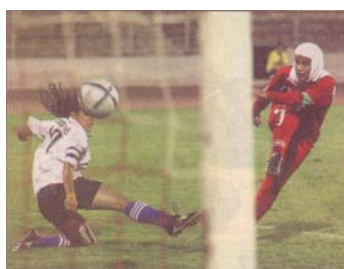
Heldekkete iranske kvinner i kamp mot palestinas landslag

Som nevnt er det mange minoritetsspråklige som bruker mye av sin fritid til skolearbeid, og dermed finner det vanskelig å kombinere dette med tidkrevende fritidsaktiviteter. Dessuten er det noen, spesielt jenter, som får oppgaver i hjemmet som kan gjøre det vanskelig å bruke tid på seg selv.