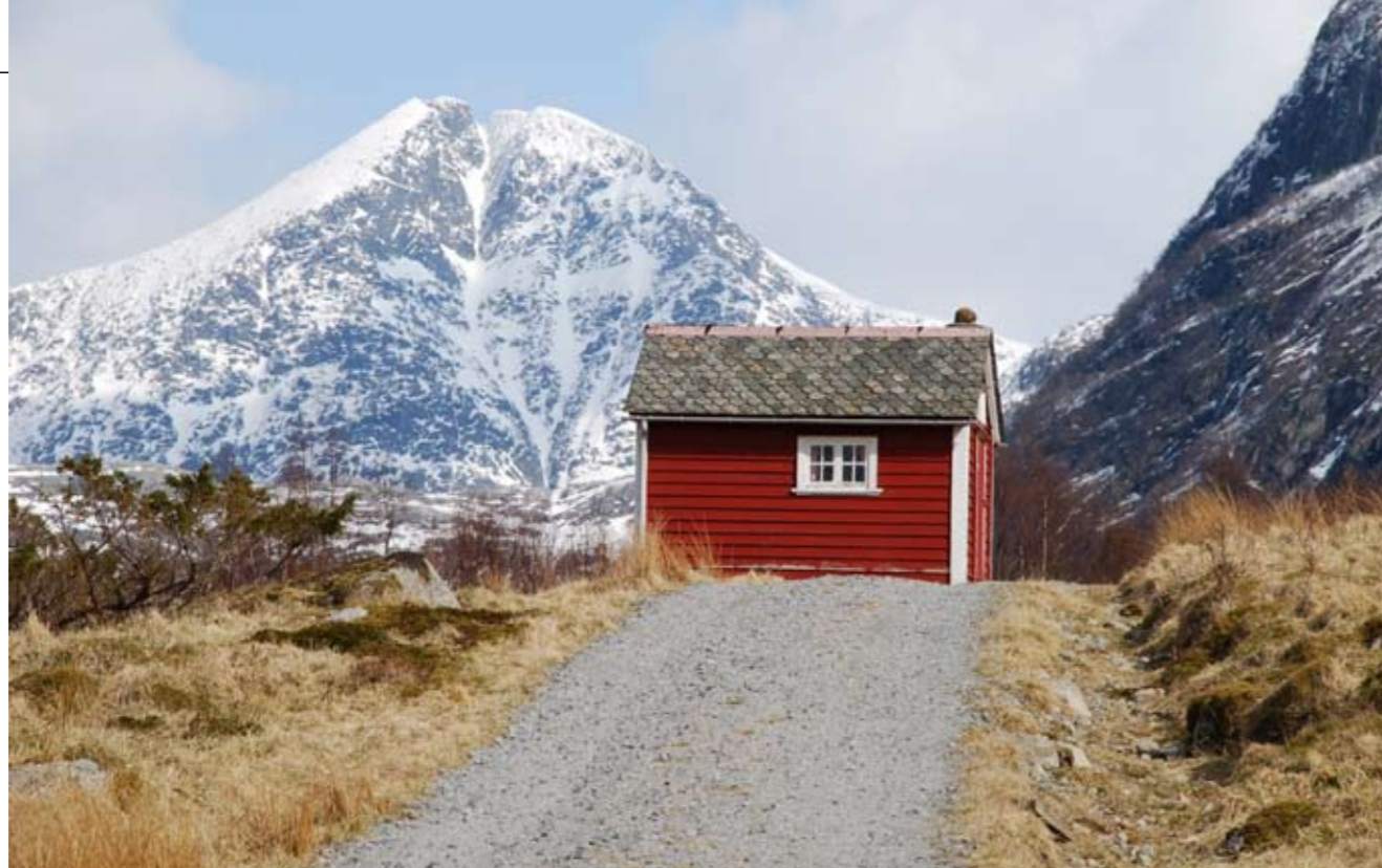
Vegen til Myrdalsvatnet med Gygrastol i bakgrunnen

56 stiar over heile kom- munen i alle vanske grader