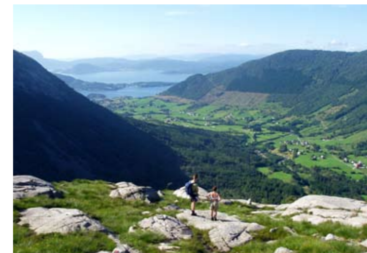
Kalkstasjonen - Geitdalstind

I heile Kvinnherad kan du gå på tur. Du kan rusla langs elvar med bar- nevogn, eller køyra rullestol. Vi har kjekke småturar som eignar seg for dei fleste og lange fjellturar for dei sprekaste. Finn informasjon og kart her: www.visittsunnhordland.no