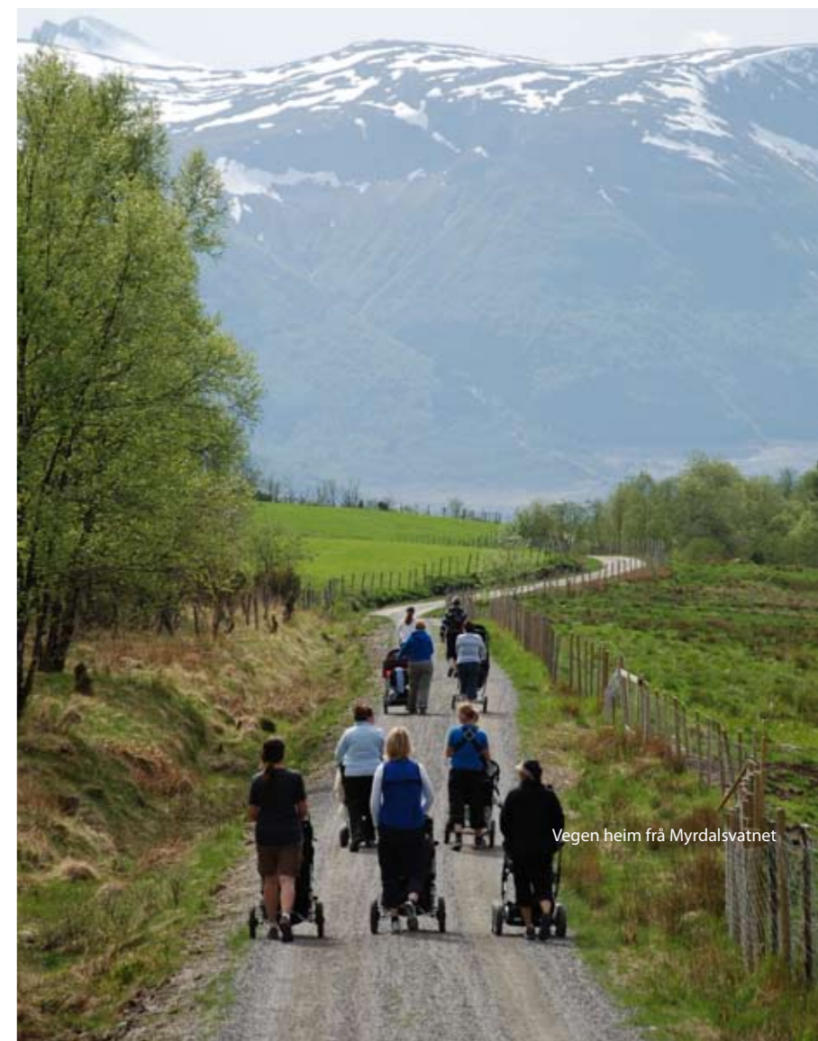
Vegen heim frå Myrdalsvatnet

○ Her står du no You are here now Jetzt sind Sie hier P Parkering Parking Parken