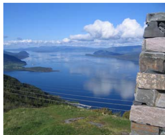
Skålafjell utsyn over Hardangerfjorden mot Stord