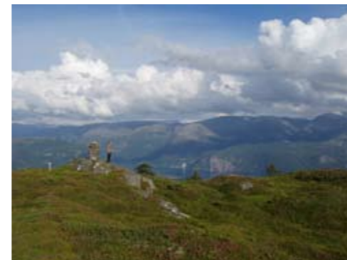
Varden på Varaldsøy, Furebergfossen bak