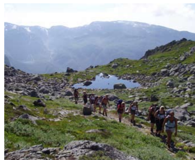
I Gjeldfeskaret på veg til Breidablikk og Fonnabu