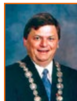
Ordfører Inge Reidar Kallevåg Kommunenes Sentralforbund